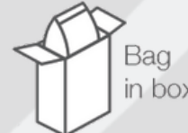
Bag in box