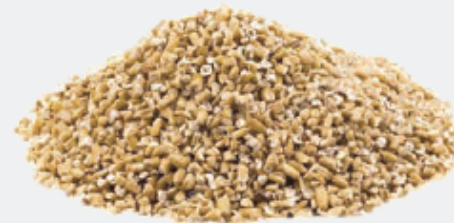
STEEL CUTTED GROATS