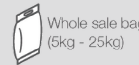
Whole sale bag (5kg - 25kg)