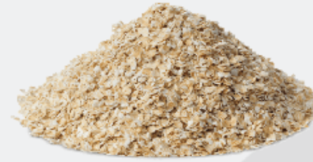
QUICK COOKING OATS